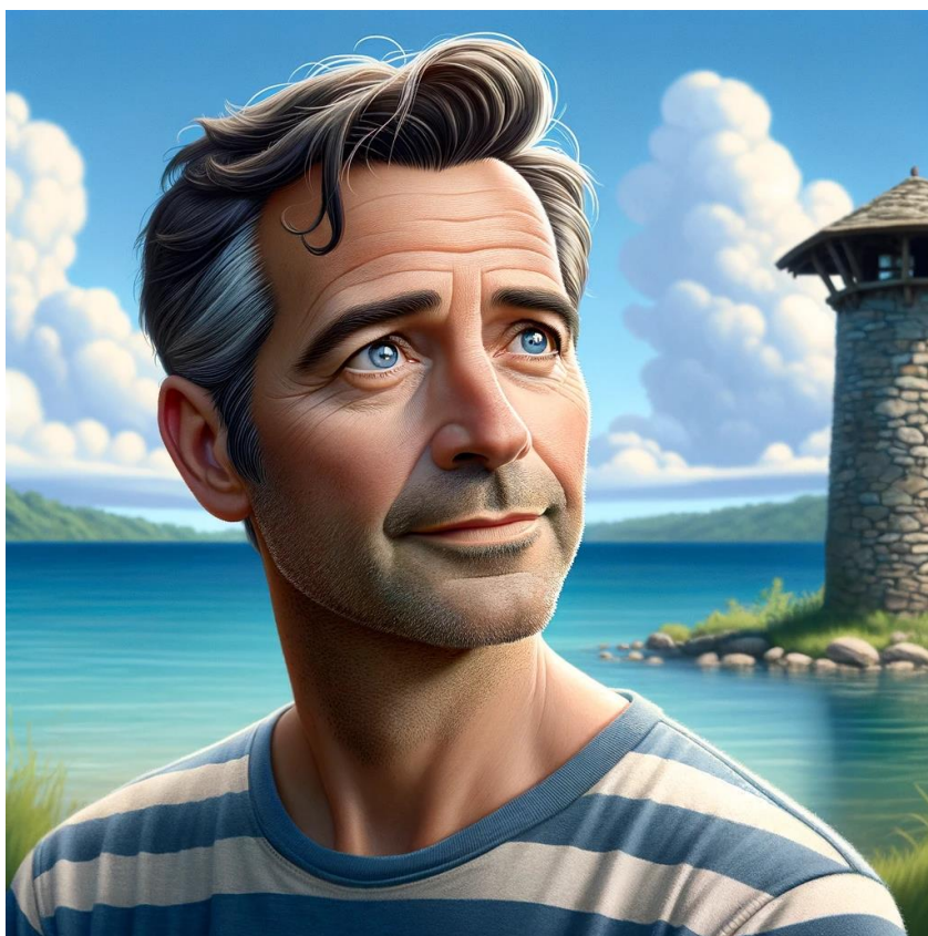
OpenAI. (2024). ChatGPT [Large language model]. /g/g-gFFsdkfMC-cartoonize-yourself