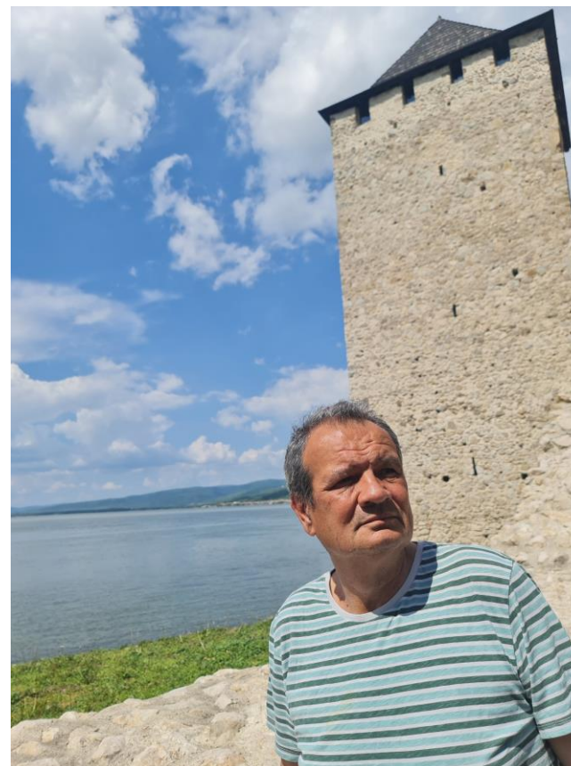
Trener na Golubačkoj tvrđavi