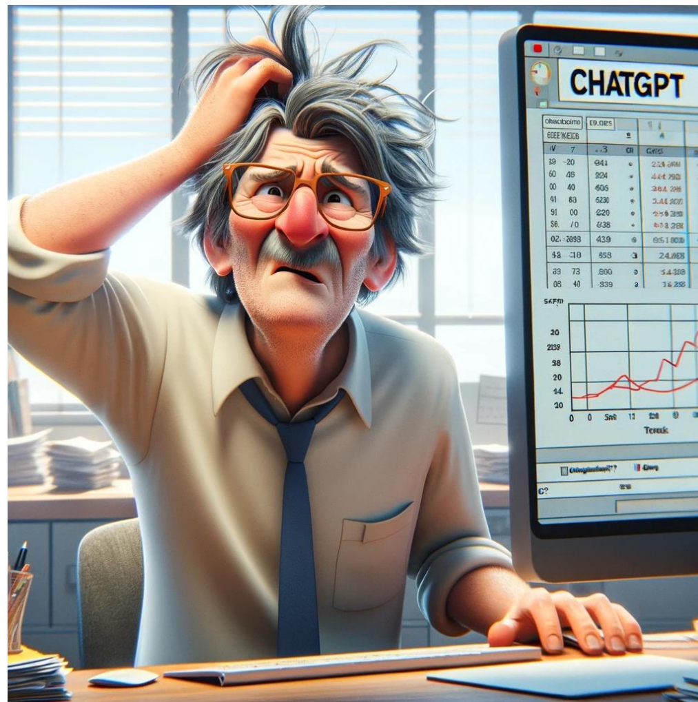
„Slika zbunjenog statističara" Generisao DALL·E